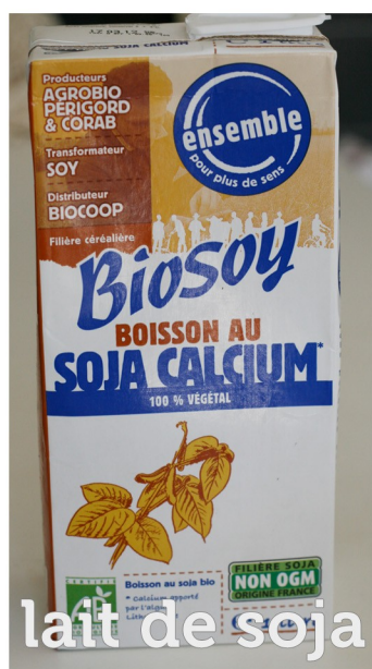
lait de soja