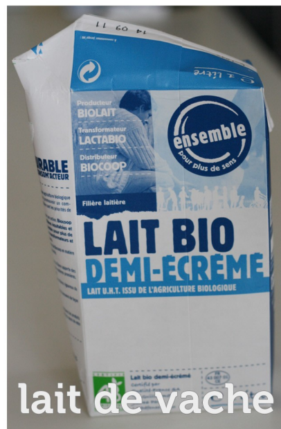
lait de vache